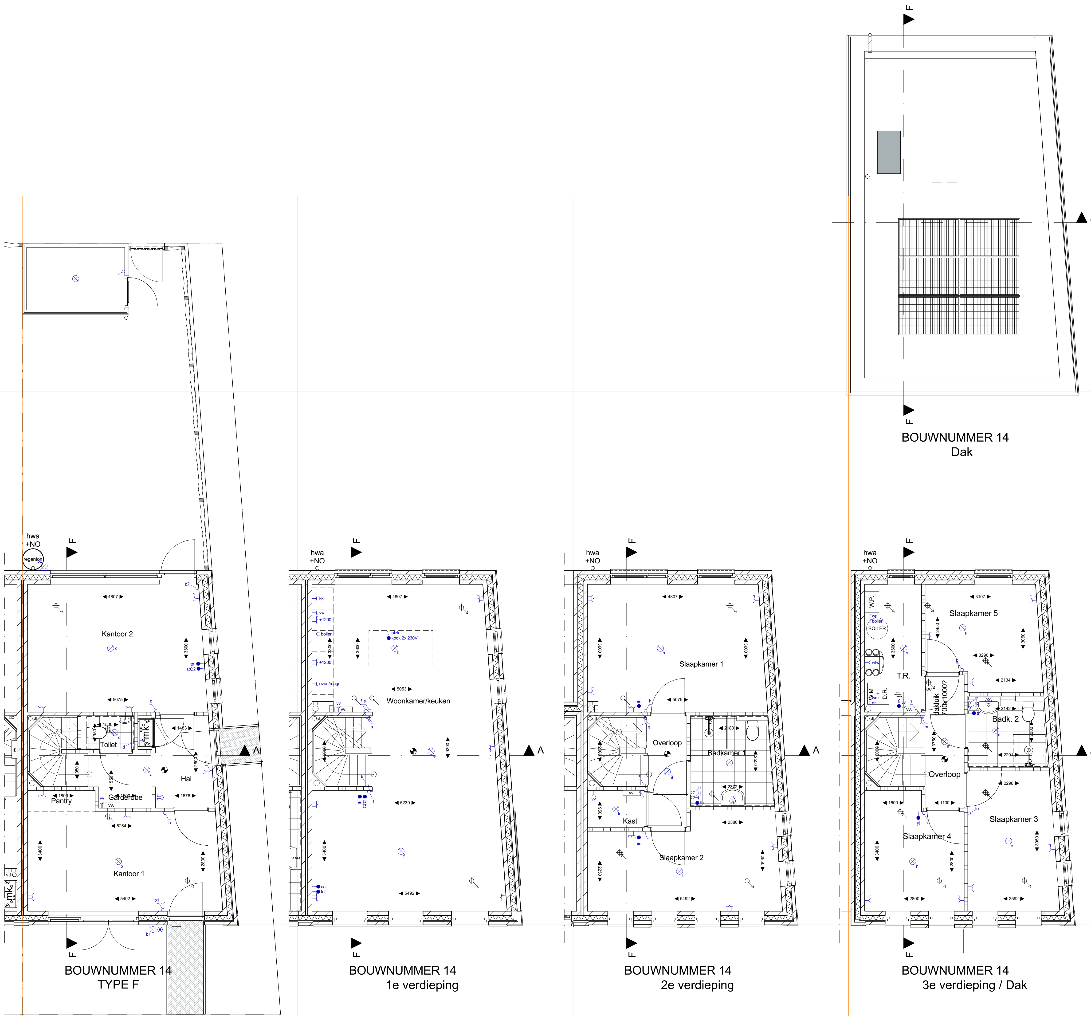
BOUWNUMMER 14 TYPE F